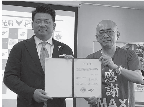
大阪観光局(左)と大阪調理製菓専門学校(右)の代表者が協定書を受け取る。背景には「感謝MAX」の看板が写っている。

大阪調理製菓専門学校は、今年度の締結で2025年理製菓専門学校(大阪府泉州市東豊中町)と連携協定を締結し、泉州地域の観光振興に貢献する。今回の締結で、2025年理製菓専門学校(大阪府泉州市東豊中町)と連携協定を締結し、泉州地域の観光振興に貢献する。